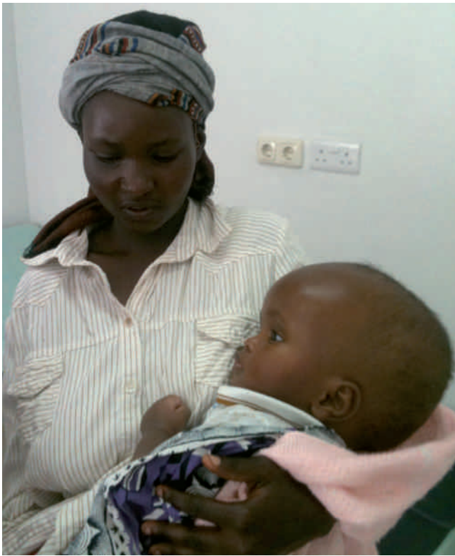
Kind mit Hydrocephalus