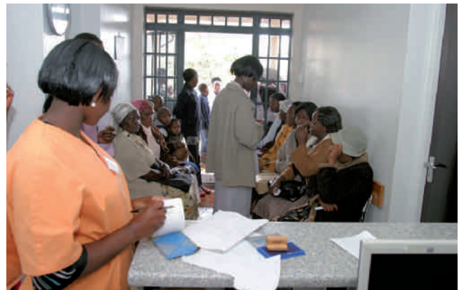
Alltag im Medical Centre, Buru Buru