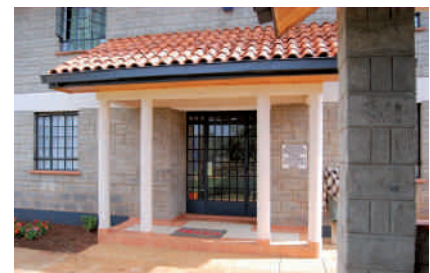
Eingang des Medical Centre

In Nairobi wartete nach Pass- und Zollkontrolle zunächst das übliche Verkehrschaos auf uns. Im Zentrum trafen wir Henry, unseren Fahrer. Er lenkte uns sicher durch das Gewühl