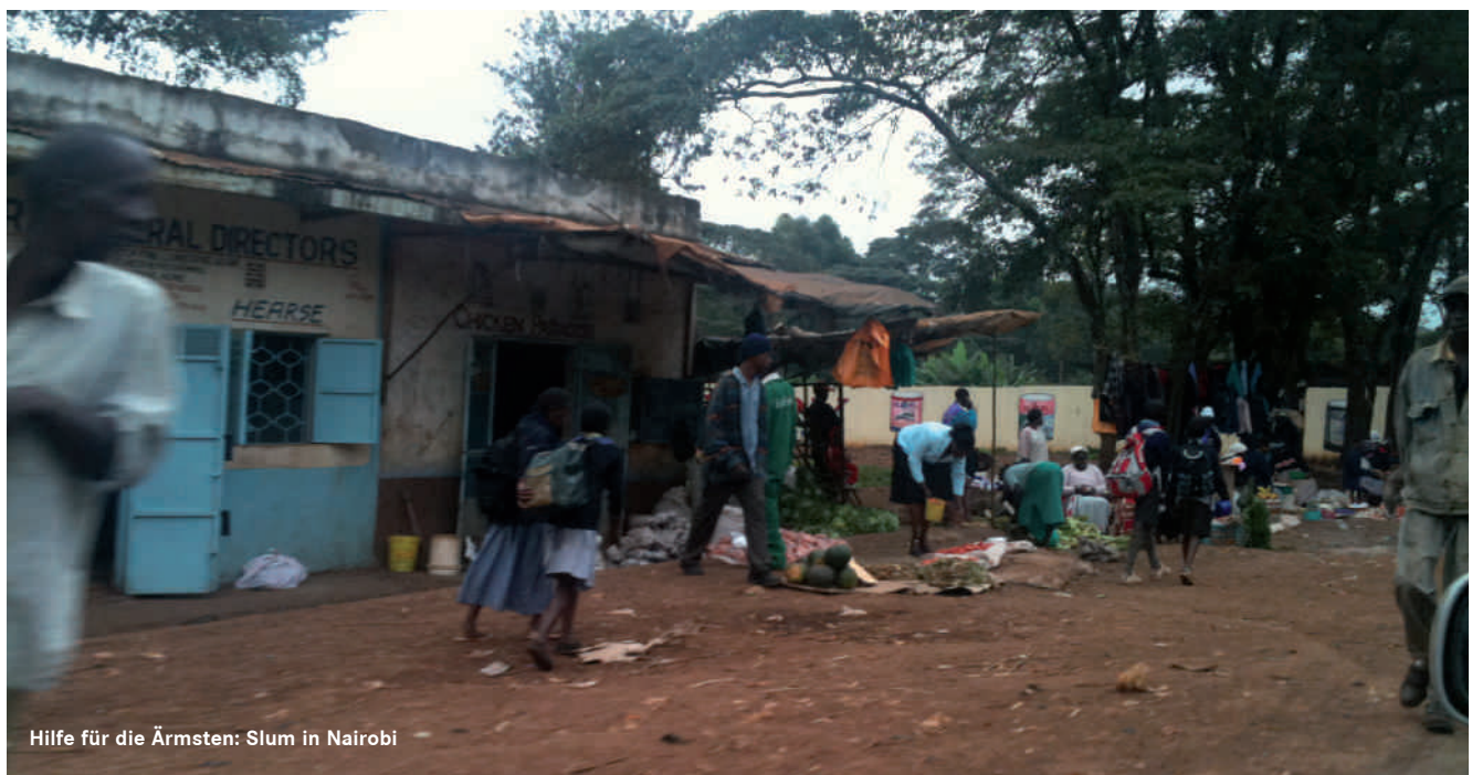
Hilfe für die Ärmsten: Slum in Nairobi