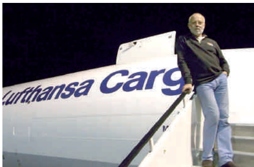
... und auf dem Weg zum Einsatzort

Die Praxis ist zweckmäßig eingerichtet, natürlich nicht mit unseren vergleichbar, aber für dortige Verhältnisse top. Mal ehrlich, sahen die Praxen unserer Vorgänger nicht ähnlich oder viel weniger gut aus? Ist der Aufwand, den wir treiben und treiben müssen, wirklich nötig? Ich war sehr zufrieden, es ließ sich vortrefflich arbeiten. Leider hatten wir fast nie Strom. Es ging aber auch so. Daran wird gearbeitet, wie ich gelesen habe.